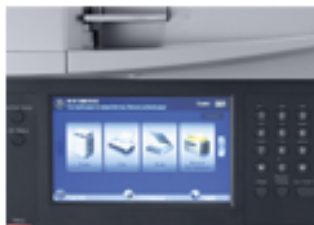
Ventana LCD: amplia visualización con acceso directo al menú de opciones.

Simplifica tus tareas con una pantalla táctil LCD de 7", la información se ve de forma clara y concisa con opciones de menú accesible desde la LCD. La navegación es muy sencilla y minimiza el tiempo de trabajo. Cada segundo ahorrado es un paso adelante para mejorar la productividad.