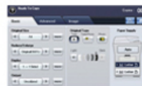
Opciones de función: personaliza las funciones de la impresora de acuerdo con tus necesidades para que no pierdas tiempo.