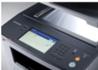
Panel de control: claro y sencillo.