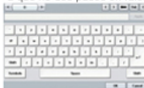
Teclado táctil: para que realices el proceso de trabajo de una forma más individual.

Accede a muchas funciones con una interfaz única y de fácil uso. Puedes ver la ayuda general a través de la característica manual "Consejos para el usuario". Incluso para que trabajar con la impresora sea mucho más fácil, puedes establecer una visualización completa de la organización y el flujo del menú.