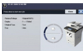
En funcionamiento: leer la información disponible en la pantalla te ayudará a que no des pasos en falso.